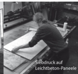
Siebdruck auf Leichtbeton-Paneele