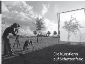
Die Künstlerin auf Schattengang